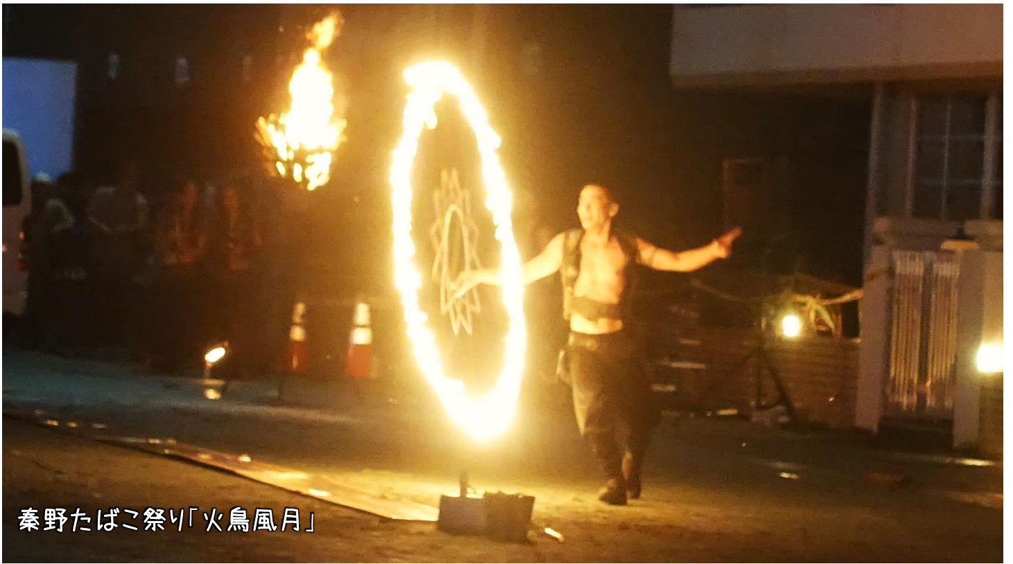
秦野たばこ祭り「火鳥風月」