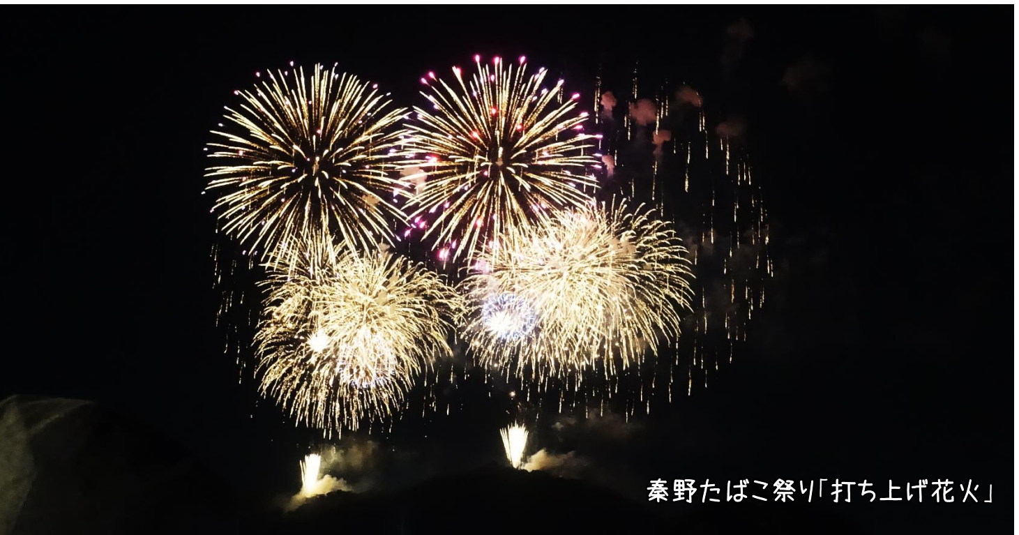
秦野たばこ祭り「打ち上げ花火」