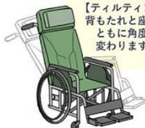
リクライニング・ティルトタイプ