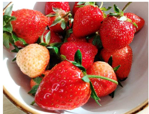
ひまわり農園で収穫！