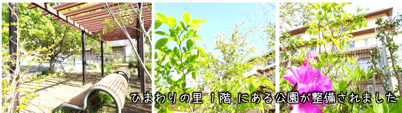
ひまわりの里 1階にある公園が整備されました